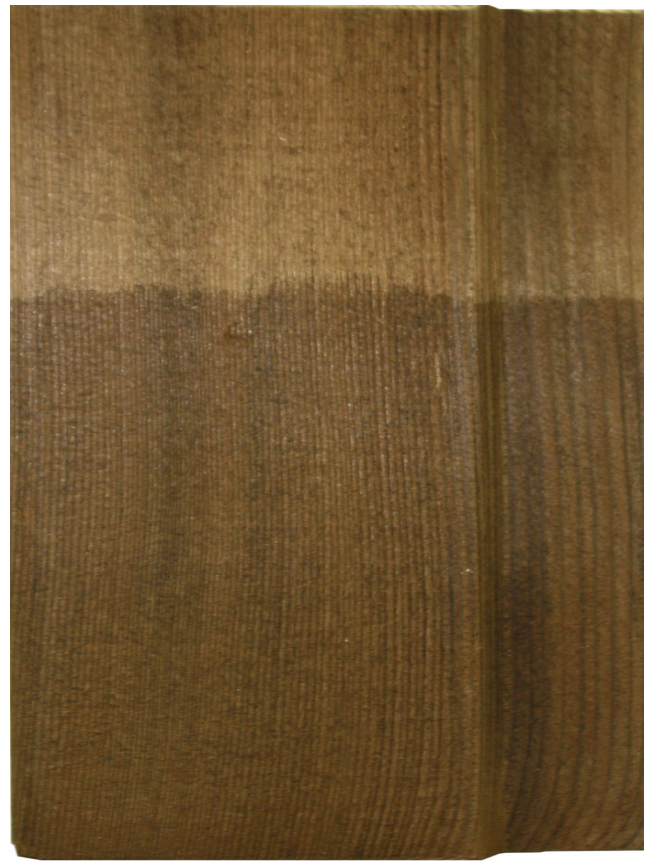
1 couche d'Arbezol Aqualin orme sur bois autoclave, brun