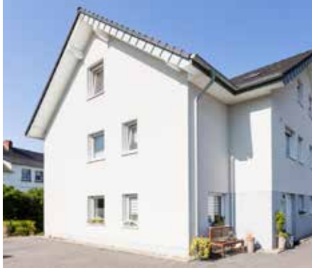
Bild 6.1: Algenfreie Fassade mit Dachüberstand und keiner Bepflanzung

→ hydrophiler Oberfläche – hier wird das Wasser bewusst in den oberen Bereich des Systems kurzfristig „eingelagert“, um dann durch eine schnelle Rücktrocknung wieder aus der Beschichtung zu entweichen.