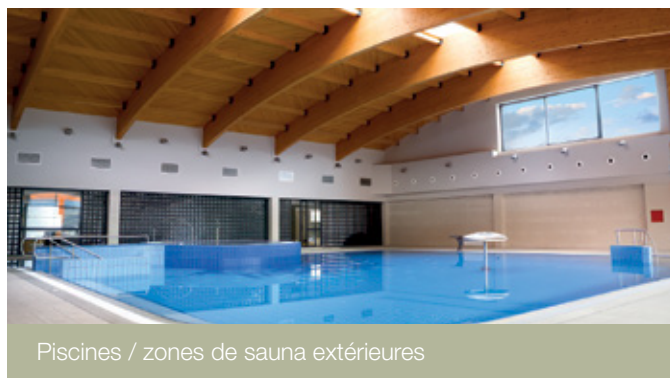
Piscines / zones de sauna extérieures

«Une solution durable à forte valeur ajoutée.»