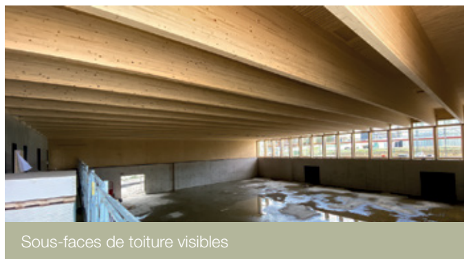
Sous-faces de toiture visibles

Les surfaces revêtues d'ArboShield UV sont moins sujettes à l'encrassement. De plus, la saleté accumulée pendant le transport ou sur le chantier se nettoie facilement.